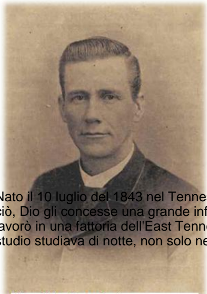
Theophilus Brown Larimore

Sono pochi i cristiani delle recenti generazioni ad aver toccato i più profondi abissi della povertà e dell'oscurità e ad essere assurti alle più alte vette della popolarità come accadde a Theophilus Brown Larimore.